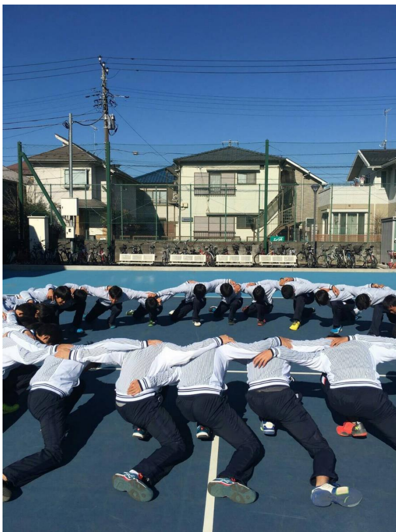
日本大学テニス部